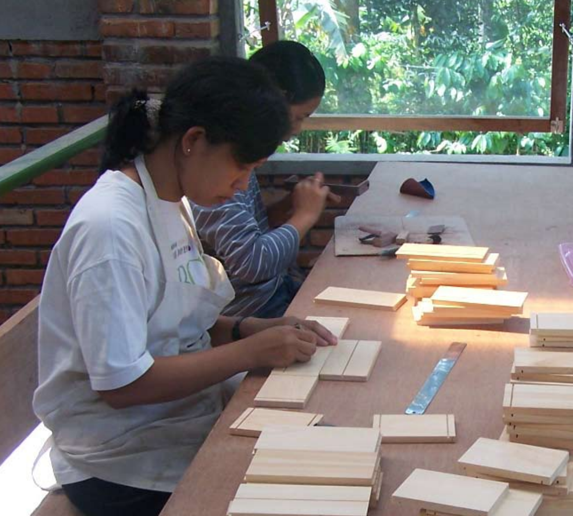
Preparation of the radio body parts (pine wood). Zuschnitt der Einzelteile (Pinienholz).