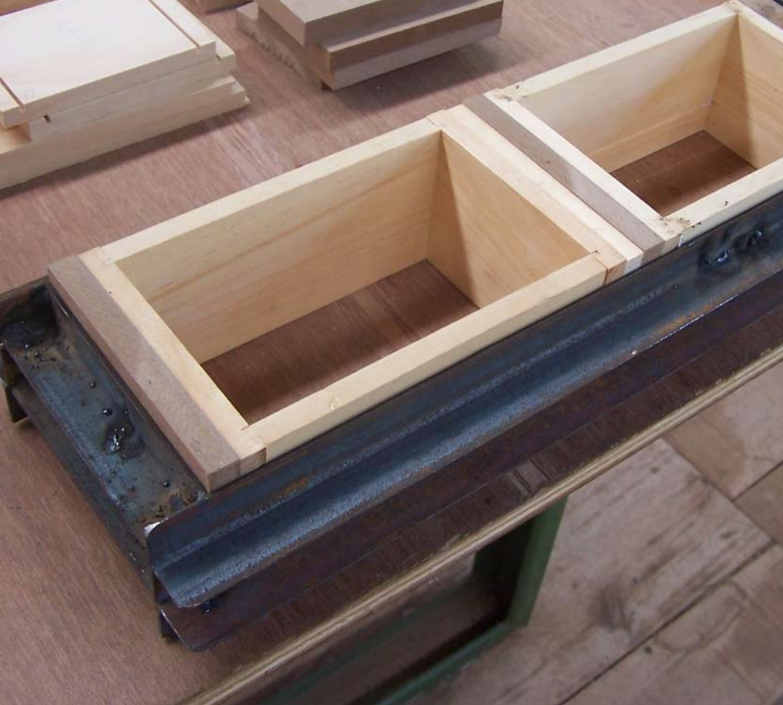
Gluing of the radio body. Verleimen des Gehäuses.