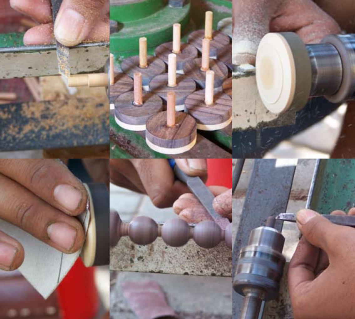
Manufacturing of the dials, the antenna knobs and battery casing locks. Anfertigung der Regler, des Antennenknopfes sowie des Batterieverschlusses.