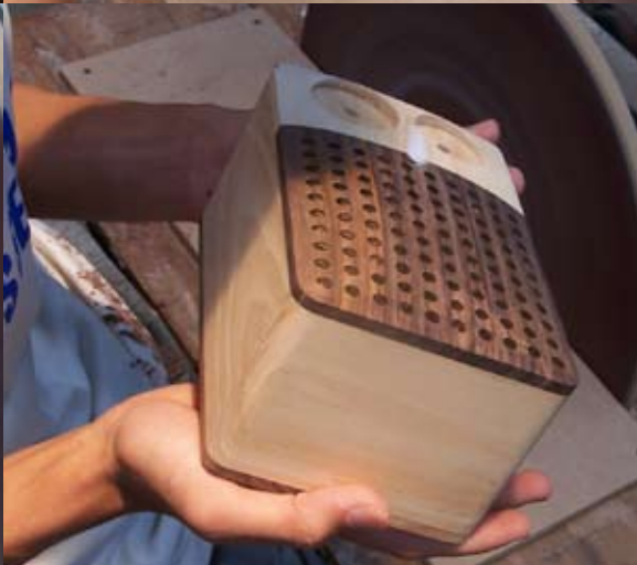
Assembling and smoothing of the radio body. Zusammenbau und Glättung des Gehäuses.