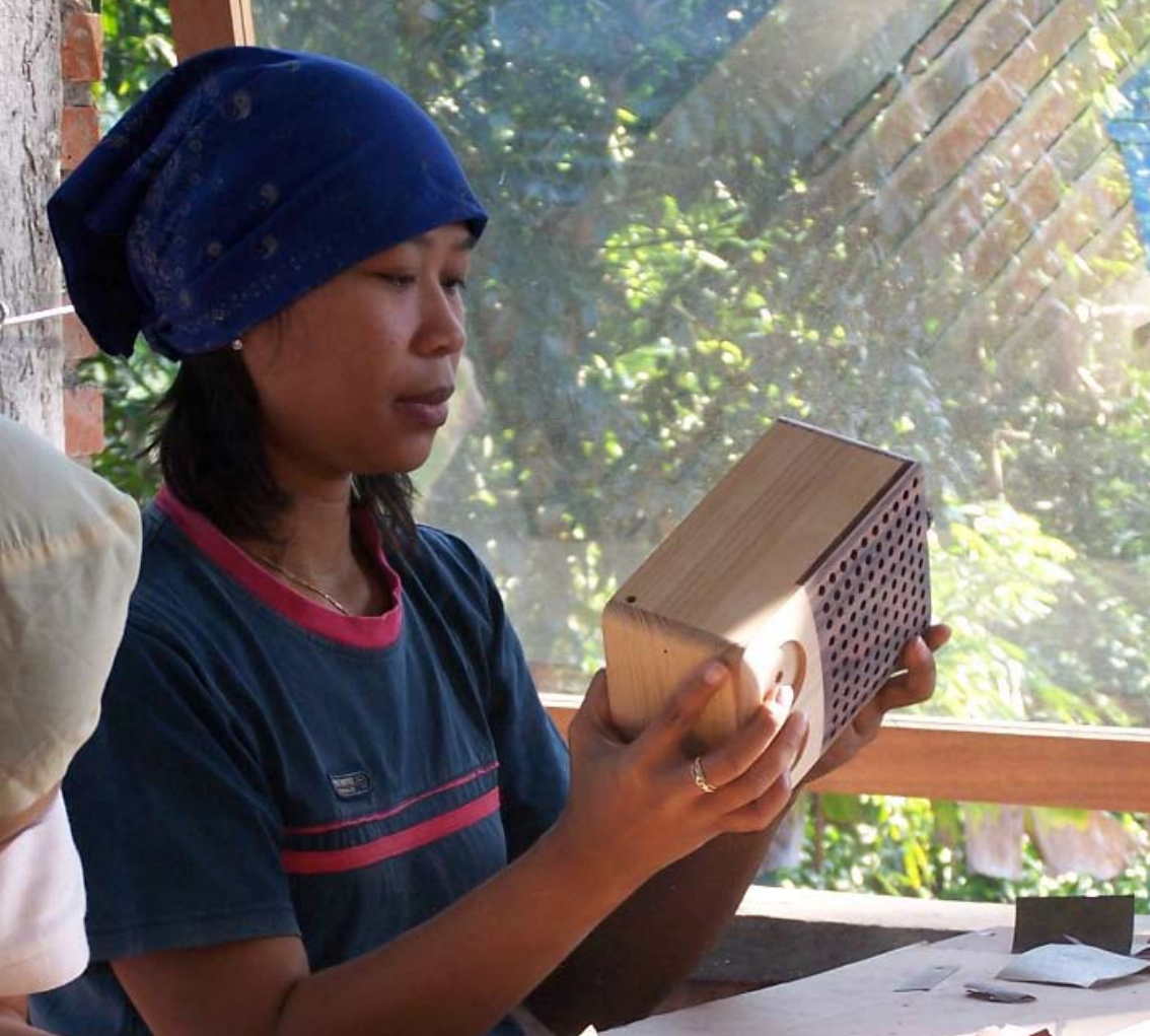
Final sanding. Feinschliff.