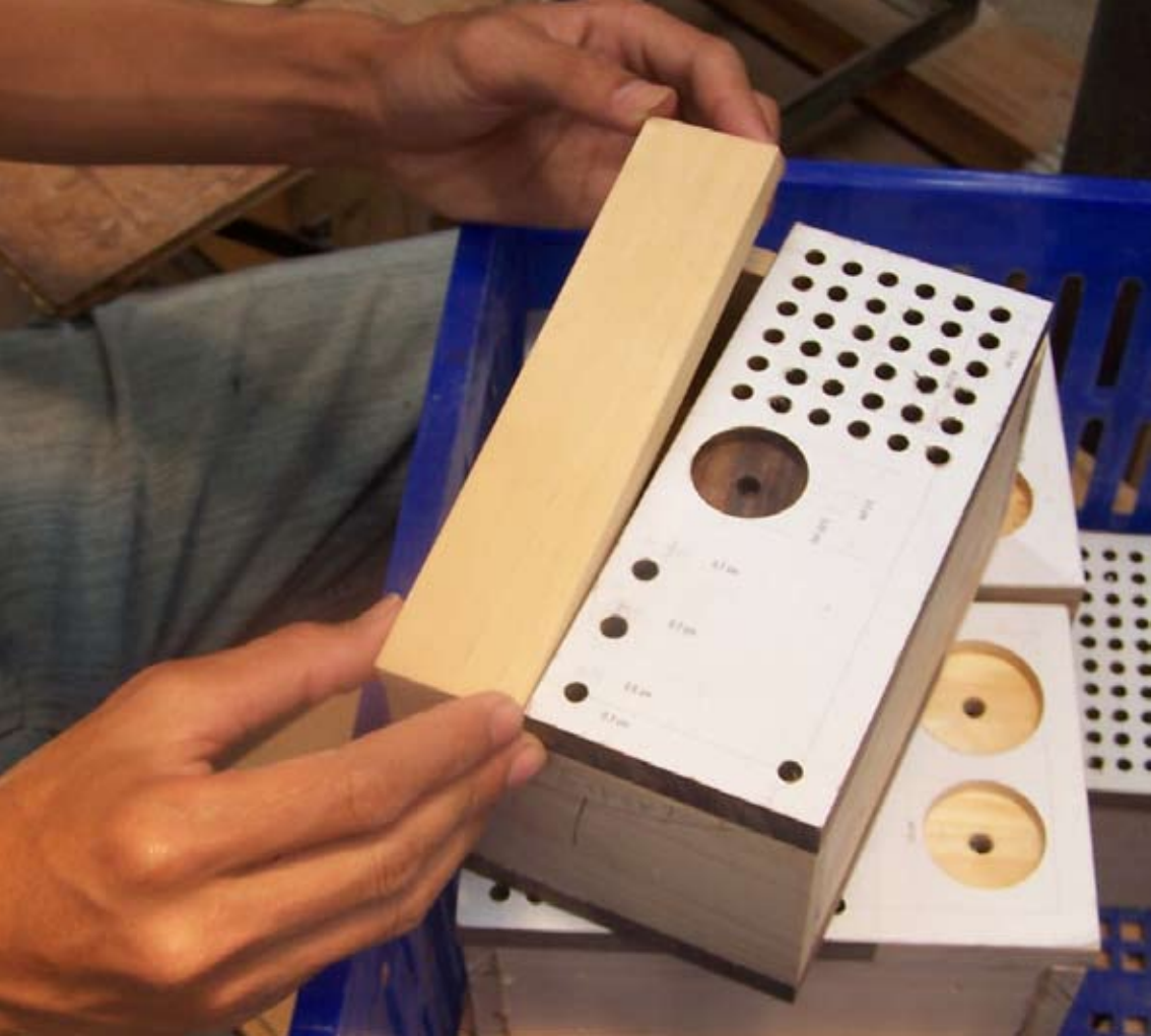
Fitting of the front and back parts. Anpassung der Vor- und Rückseite.