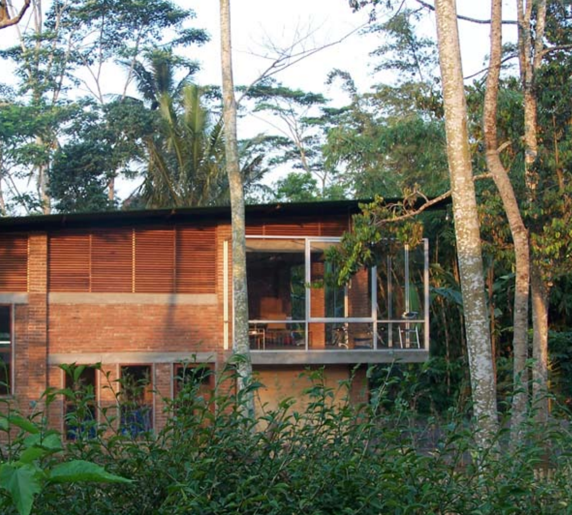
Design- and production workshop in Temanggung, Central Java, Indonesia. Designwerkstatt und Produktionsstätte in Temanggung, Mittel-Java, Indonesien.